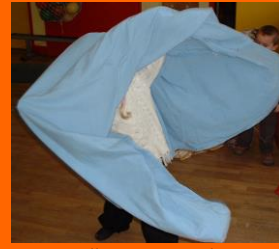
Ecole maternelle, Ty Douar de Locmiquélic

Mettre ensuite en scène sur une silhouette en