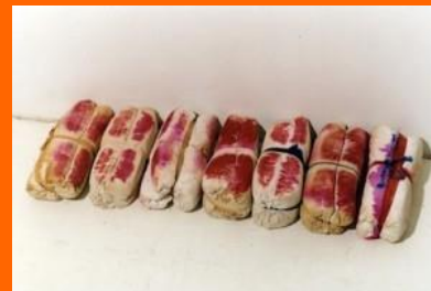
Patrick SAYTOUR, Sans titre , 1970