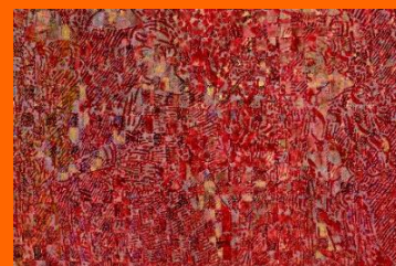
François ROUAN, Jardin marbre , 1976-77