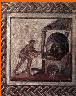
Les travaux et les jours de saint romain-en-gal, mosaïque Gallo-romaine