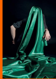
Exposition « Fantôme » Rennes 2017