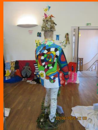
Exposition départementale 2015, Buchy