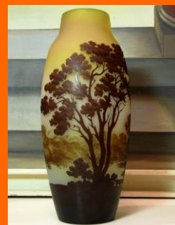
Emile GALLE, Grand vase à décor de paysage, 1900