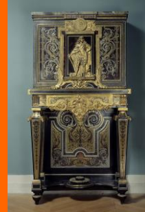
BOULLE, Un cabinet de représentant Louis XIV