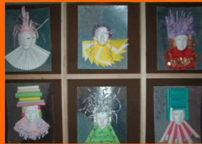
Ecole Jean Macé, CP, Cols et coiffes