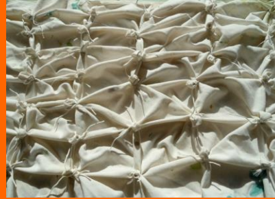
Simon HANTAÏ, Les nœuds des Tabulas