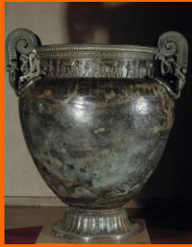
Le trésor de Vix, Age de fer