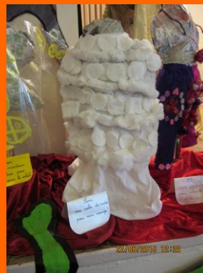
Exposition départementale 2015, Buchy