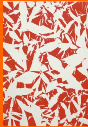
Simon HANTAÏ, pliage , 1969