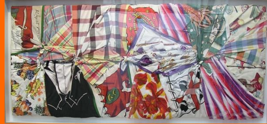
Gérard DESCHAMPS Torchons et serviettes, 1961

S'entraider pour accrocher les tissus et textiles. On peut faire de gros nœuds ou ajouter des bourrages de tissu pour accentuer le relief.