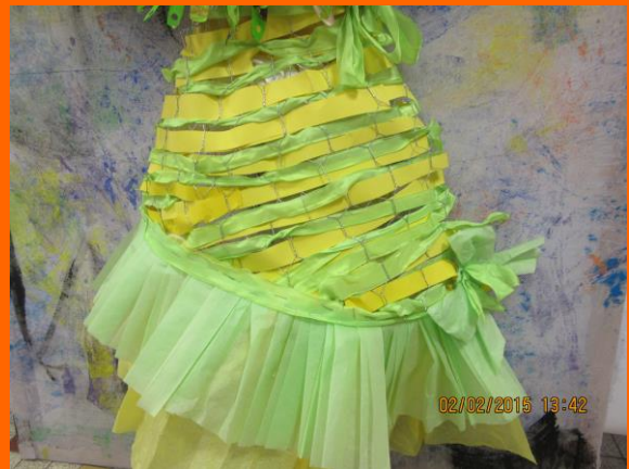
Exposition départementale 2015