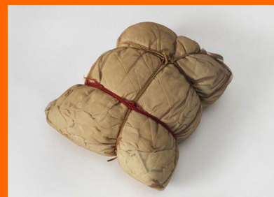
CHRISTO, Emballage , 1963