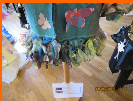
Exposition départementale 2015, Buchy