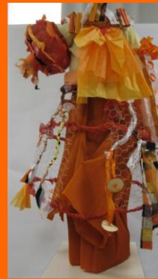
Exposition départementale 2015