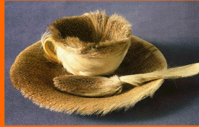
Meret OPPENHEIM, le déjeuner en fourrure , 1936