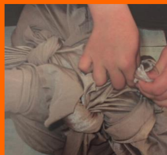
Emballage, Ecole La Fontaine, Vals près-le-Puy